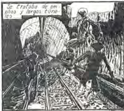
Se trataba de amplios y largos túneles