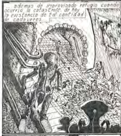
además de improvisado refugio cuando ocurrió la catástrofe, de hay la existencia de tal cantidad de cadáveres