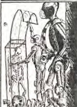
cuyos esqueletos estaban en su mayoría completos, razón por la que nos serían de cierta utilidad para nuestra investigación