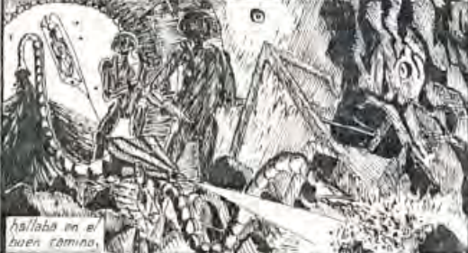
hallaba en el buen camino