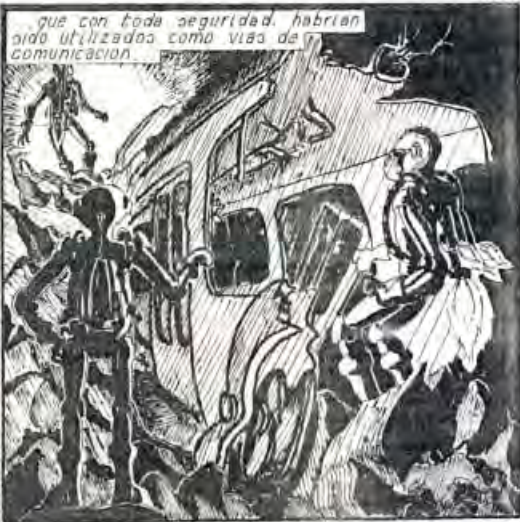
que con toda seguridad, habrían sido utilizados como vías de comunicación