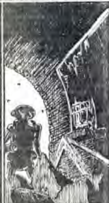
Pero lo principal sus documentos, según brillando por su ausencia