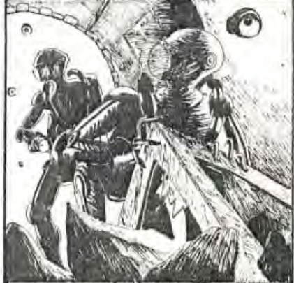
aun que cuando dirigí mis pasos hacia los acúmbros de donde vi sobresalir unos resacas metálicos, no pude ni suponer que me